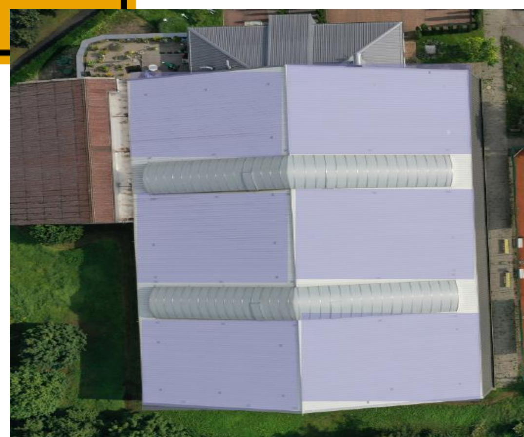
Squash & Tennishalle